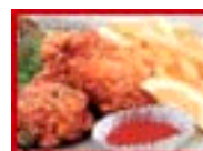
とりのからあげ 380えん