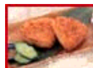
やきおにぎり 300えん